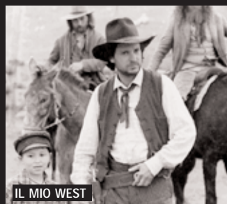
IL MIO WEST