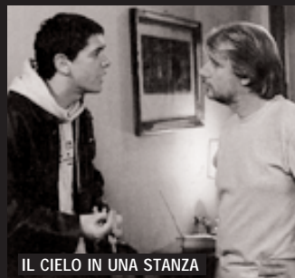
IL CIELO IN UNA STANZA