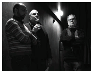
Gli ospiti intervenuti per la settimana della legalità