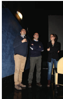
Sandro Fallani sindaco di Scandicci